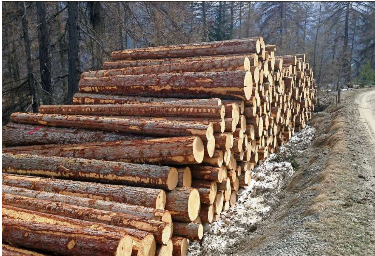
Eir scha la dumonda per laina para da crescer sun ils predschs per laina in Engiadina Bassa amo adüna bass.

Chi saja da resguardar pro'l marchà da laina duos factuors, il predsch e la retschera, declera Arnold Denoth, silvicultur dal cumün da Zernez. «Pel mumaint es il predsch pella laina i sù be minimamaing, var duos francs, quai chi correspuonda ad ün predsch in media da plus minus 90 francs al meter cubic»,